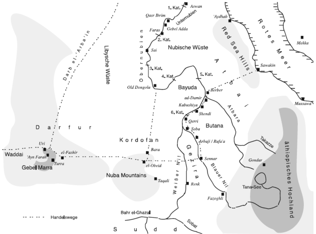
Рисунок 1. Карта-схема Северного Судана и прилегающих областей с указанием главных городов и торговых путей 268