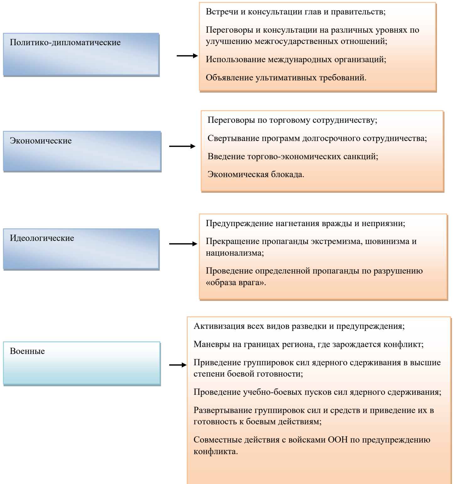
Рис. 1 – Меры предотвращения межгосударственного военного конфликта.

Разработка нормативных положений превентивной дипломатии ООН на глобальном уровне была подкреплена аналогичной деятельностью