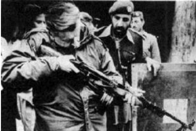
Приложение 1. Фото 3. Бжезинского во время визита в Пакистан 1980-1981 гг.